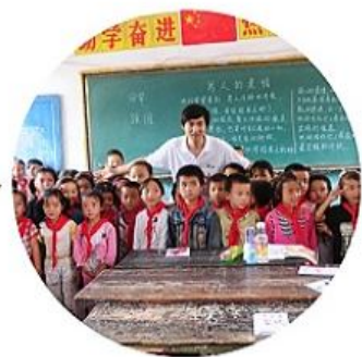
▶ 田华 著名歌手

爱自由心，从不喧哗。他和蔼慈祥，痴心一片，执迷于贫困山区的教育事业，捐资助学，一对一帮扶，低调行善，却以润物细无声的方式感动着每一位义工。