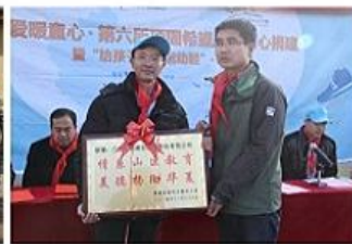
【爱心小学感谢顶固公益之行】