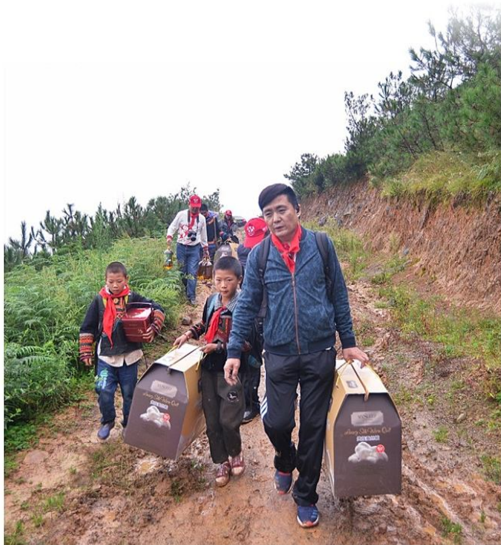
封面：图为顶固董事长林新达走访贫困家庭

地址：广东省中山市东凤镇和禧工业园 HeSui Industry Zone, DongFeng Town, ZhongShan City, GuangDong, P.R.China 邮编Code: 528425 电话Tel: 0760-22772555 网址: www.dinggu.net 全国客服热线Series Line: 400 883 5858